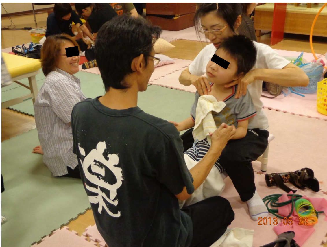
図 4 : 治療実習