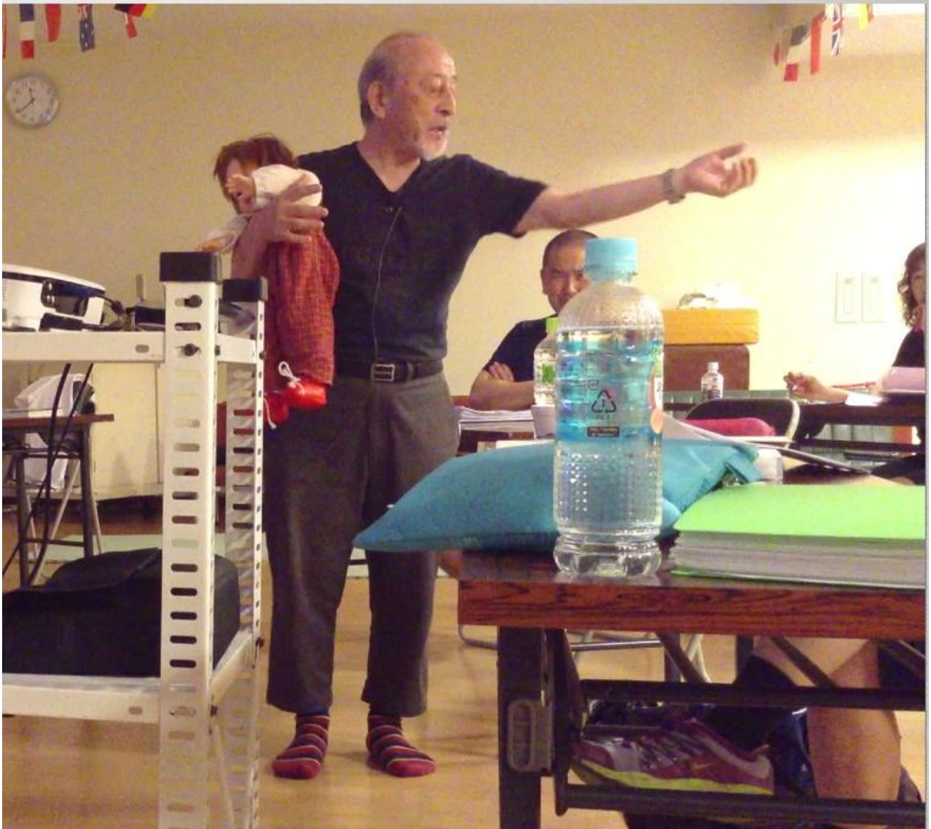
図7：講義と実技の場面