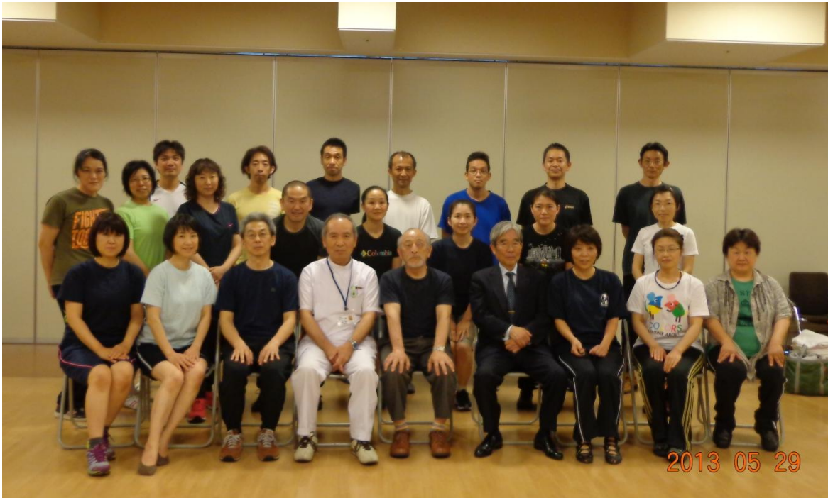
図 2 : 講習会を終えて記念撮影