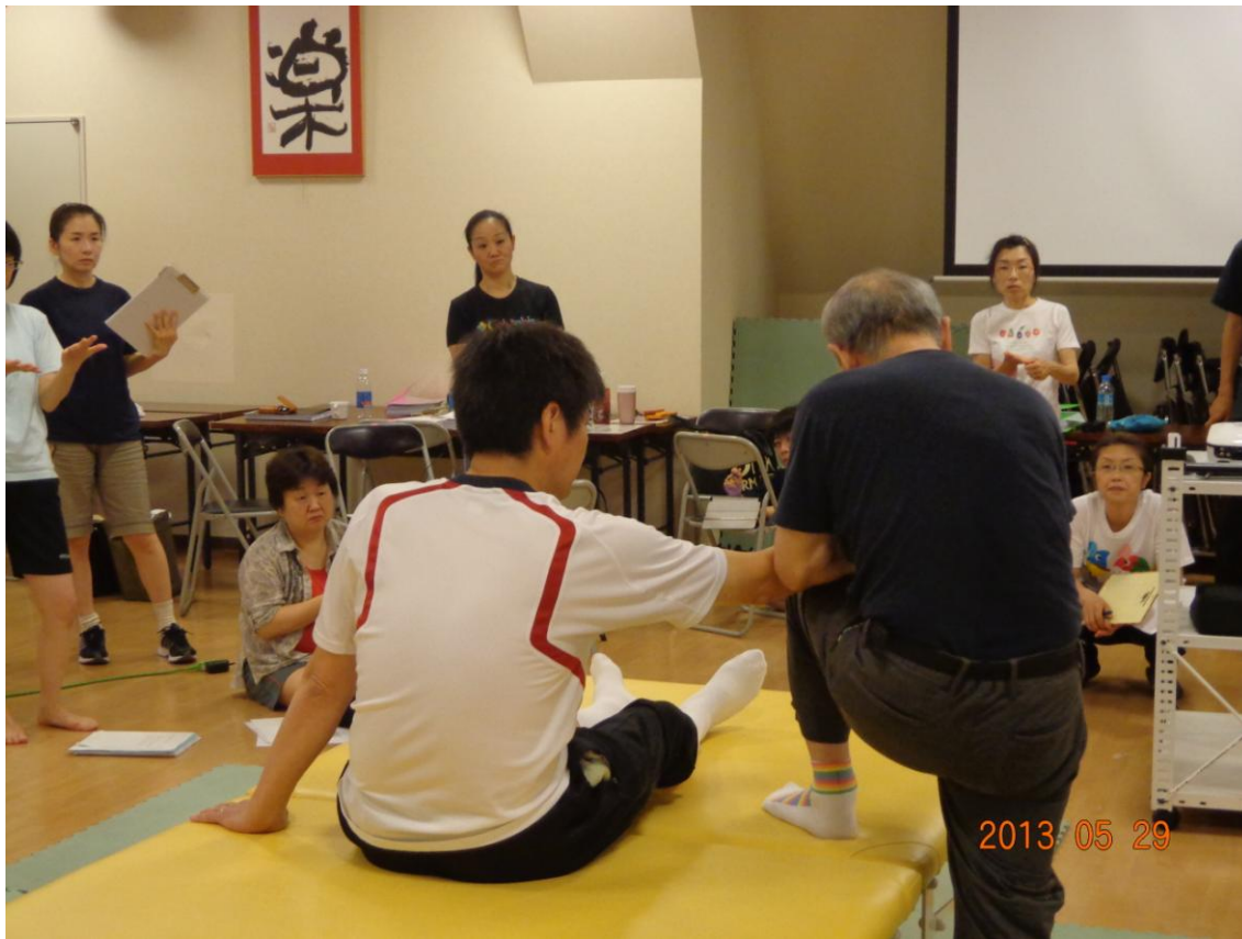
図 6：講義と実技の場面