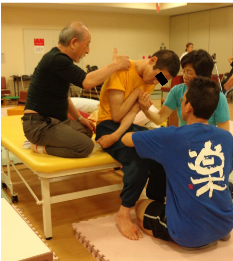
図 5 : 治療実習