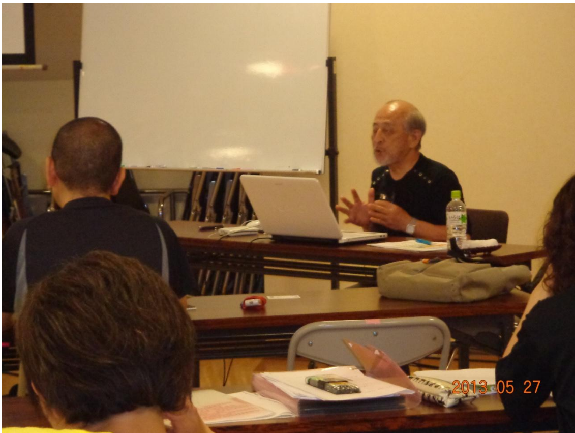
図 3 : 講義の様子